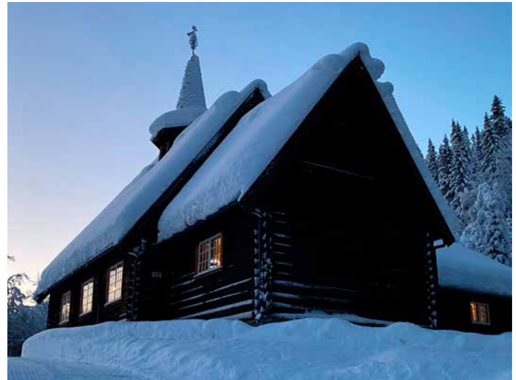
Manndal kapell i vinterprydna.

Tradisjonen tru skal det vere gudsteneste i Manndal på nyåret – nærare bestemt søndag 8. januar 2023 kl 17.00.