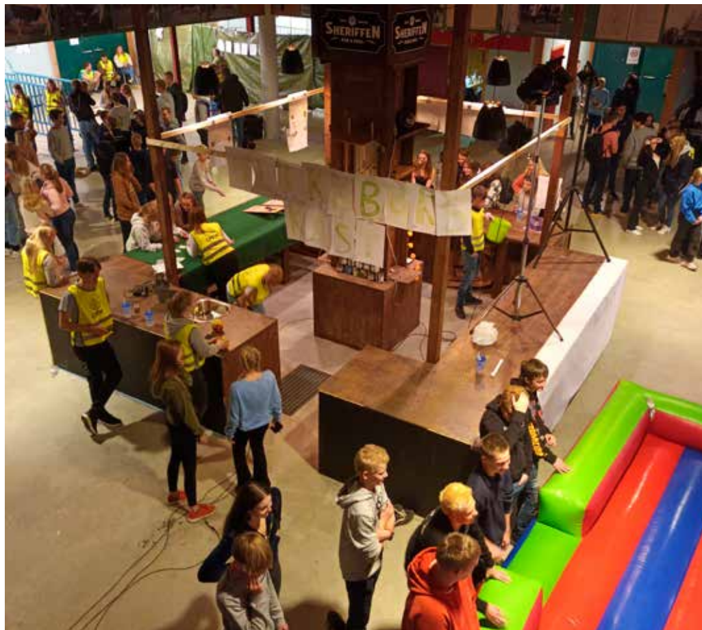
Kick-off på Dyrskuplassen

24.mars er nesten samling for saman med dei nokre av dei andre konfirmantane på Granvin Kulturhus med temaet Kirkens Nødhjelp og fasteaksjonen 2023. Meir informasjon kjem.