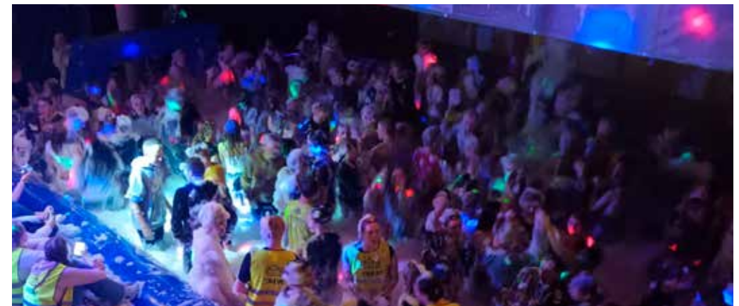
Bilete fra skumparty i Husdyrhallen.