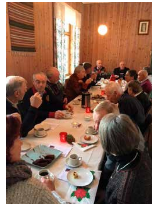
Biletet syner samling kring kaffibordet frå tidlegare år på adventsmessa på Nes bedehus.