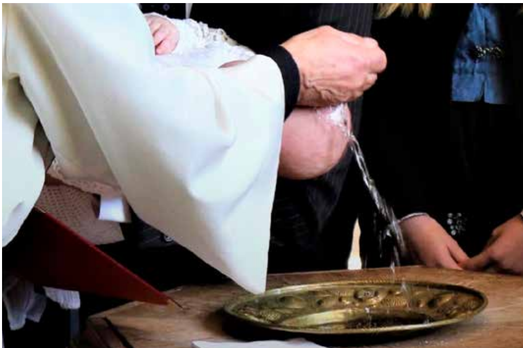
Velkomen til dåp i kyrkjene våre – Manddal, Åmotsdal, Flatdal eller Seljord.